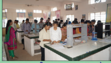
मृदाशास्त्र व कृषी रसायनशास्त्र प्रयोगशाळा