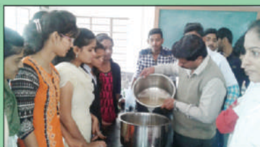
Post Harvest Tech. Lab