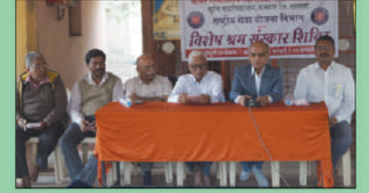
राष्ट्रीय सेवा योजना