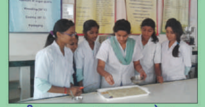
प्राणीशास्त्र व दुग्धशास्त्र प्रयोगशाळा