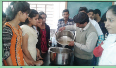
काढणी पश्चात तंत्रज्ञान प्रयोगशाळा