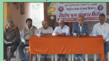
N. S. S.