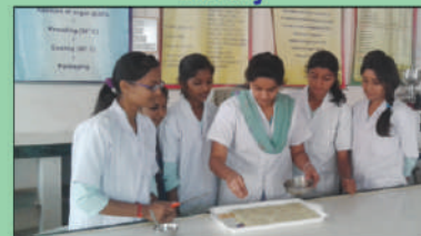
Animal Sci. & Dairy Science Lab